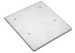
Plate forme en tôle