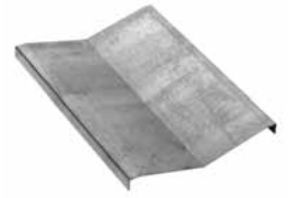
Plate forme prismatique