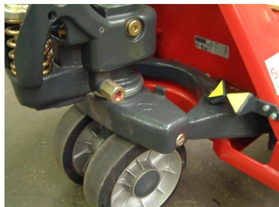
Gewichtsermittlung bei markierter Referenzhöhe