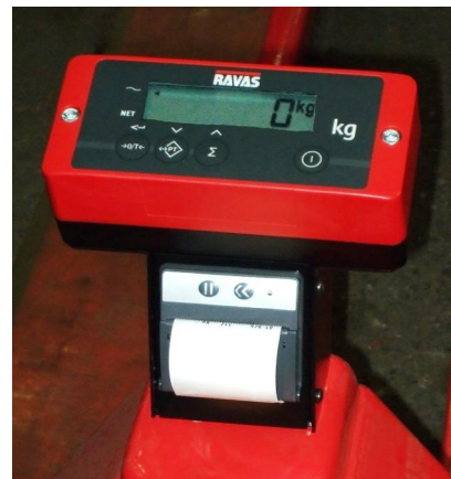
Optional mit Thermo-Einbaudrucker