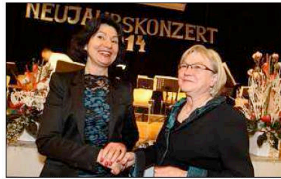
Zweimal Rosemarie mit Passaus OB-Kandidatin Weber (links) und Landratsgattin Meyer.