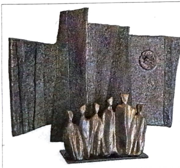
Skulptur von Lothar Blitz.