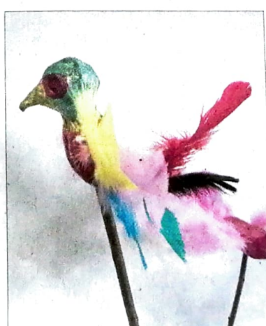
Buntes Gefieder auf zwei Stecken: der Skulpturen-Vogel.