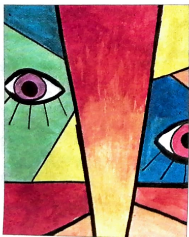
Farbenfroh: Gesicht mit Ecken und Kanten.