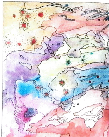
Abstrakt und ohne Titel: Hier wird der Kreativität freier Lauf gelassen.