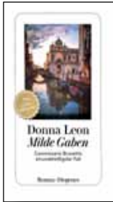
VENEDIG MILDE GABEN Donna Leon Diogenes