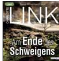
YORKSHIRE AM ENDE DES SCHWEIGENS Charlotte Link Random House Audio