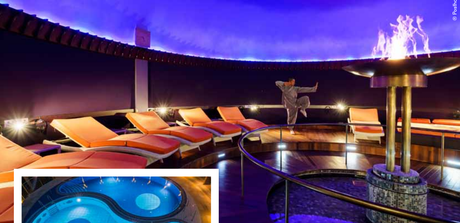
Der versunkene Tempel